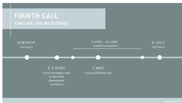
Tempistiche del quarto bando

In collaborazione con il Segretariato Congiunto di Vienna, la Regione del Veneto, quale Punto di Contatto Nazionale, organizza un incontro informativo per i potenziali beneficiari italiani.