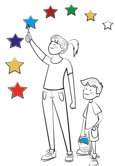
Painting our future together

Questo evento intende presentare i risultati di metà periodo di attuazione del Programma Interreg CENTRAL EUROPE e di altri Programmi di CTE di cui è referente l'U.O. Cooperazione Territoriale e Macrostrategie Europee nonché fornire informazioni sugli scenari futuri della Programmazione 2021-2027.